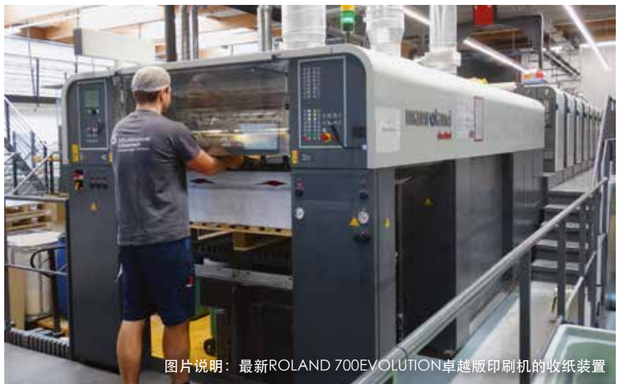
图片说明: 最新ROLAND 700EVOLUTION卓越版印刷机的收纸装置

质量第一在ODS胶印公司深入人心。管理兼具大量具有吸引力和保护的形式和功能, 公司以其定制包装产品闻名, 包括高品质食品 (如软奶酪) 的纸盒套筒和巧妙的打开方式, 配有紧密盖子的圆形盒子具有很大的货架影响力。 图片说明: 最新ROLAND 700 EVOLUTION 卓越版印刷机的收纸装置